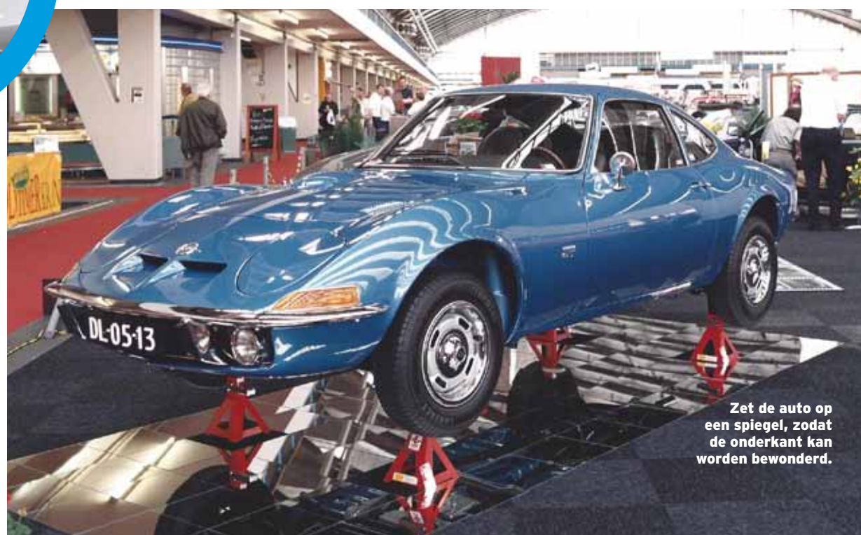
Zet de auto op een spiegel, zodat de onderkant kan worden bewonderd.

Met zijn Opel GT uit 1969 won Geert Snellen niet alleen het Concours d'Élégance Paleis Het Loo, maar pakte hij ook eerste prijzen bij concoursen in onder meer Duitsland, Groot-Brittannië, Denemarken en Hongarije. De Opel heeft hij inmiddels verkocht om zich te kunnen richten op de klassieke race- en rallysport.